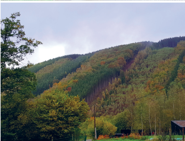
◀ Sylviculture à Trou de Bra, JNC AWP