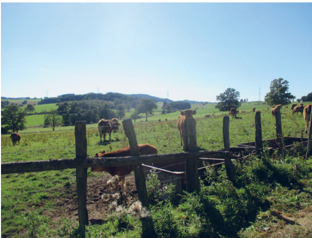
◀ Prairies pour l'élevage bovin, JNC AWP