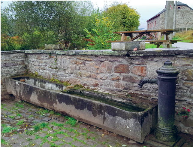
◀ Bac d'eau à Lansival, JNC AWP