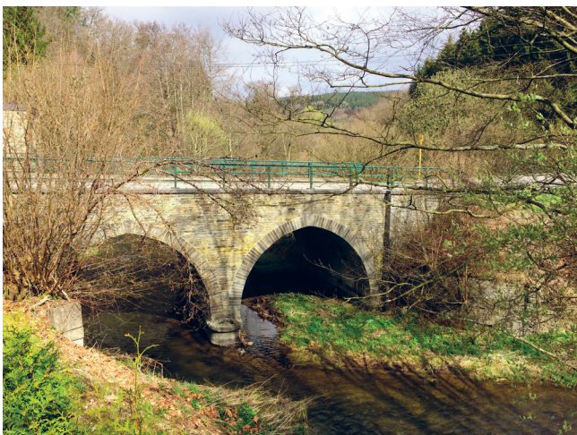
▼ Vallée de la Lienne, Pont de Villettes, JNC AWP, 2017