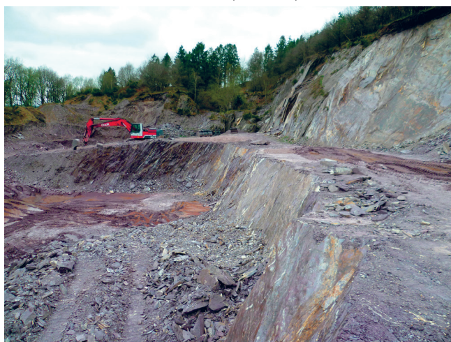
▼ Carrière de coticule Thier del Preu, JNC AWP, 2017

Lierneux ne dispose pas encore de documents relatifs à l'aménagement du territoire à l'échelle communale. L'absence d'un RCU (Guide communal d'urbanisme) et d'un SSC (Schéma de développement communal) ne permet pas de définir les volontés communales. Le PCDR et l'Agenda 21 local, associés aux chartes urbanistiques en cours , permettront aux citoyens, aux associations ... de donner leur avis et de proposer aussi bien une vision idéale, intégrale et commune pour l'avenir de leur commune, ainsi que de proposer des actions concrètes à mettre en place.