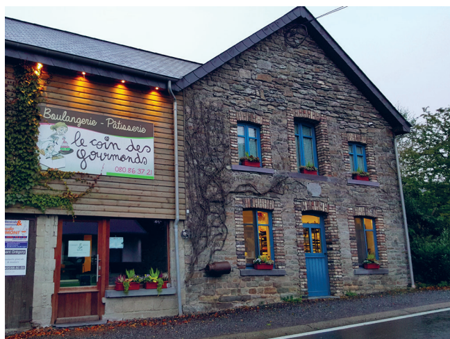
▼ Commerces de proximité dans la commune