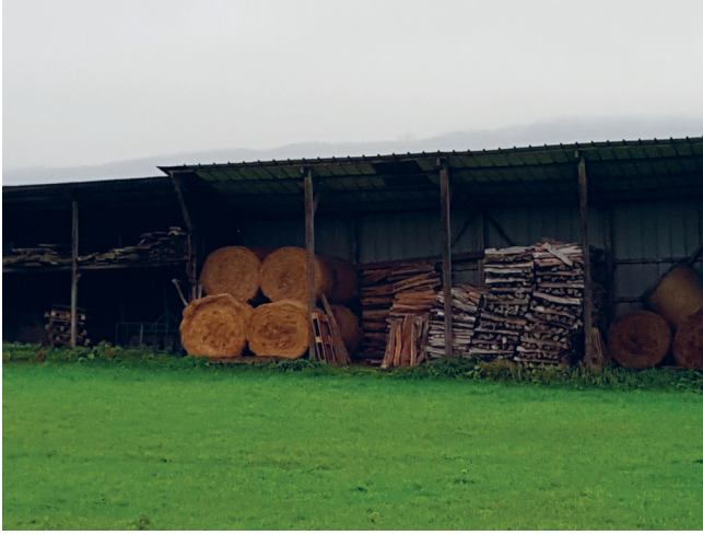
◀ Bâtiment agricole, JNC AWP