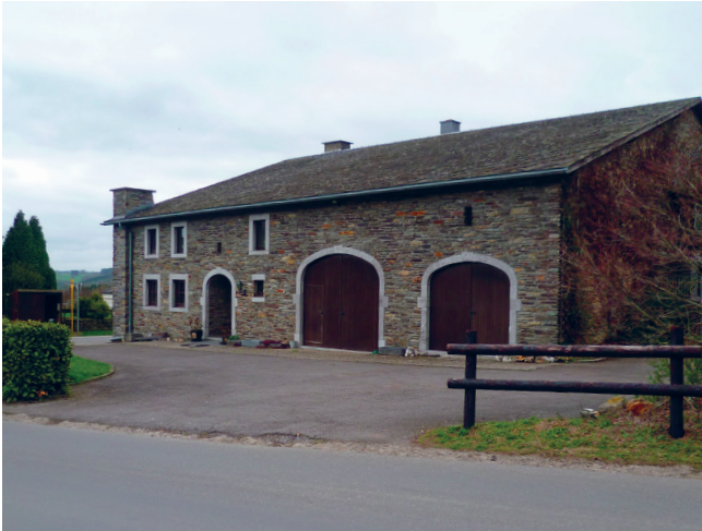
◀ Bâtiment de coeur de village, en schiste, Odrimont, JNC AWP, 2017