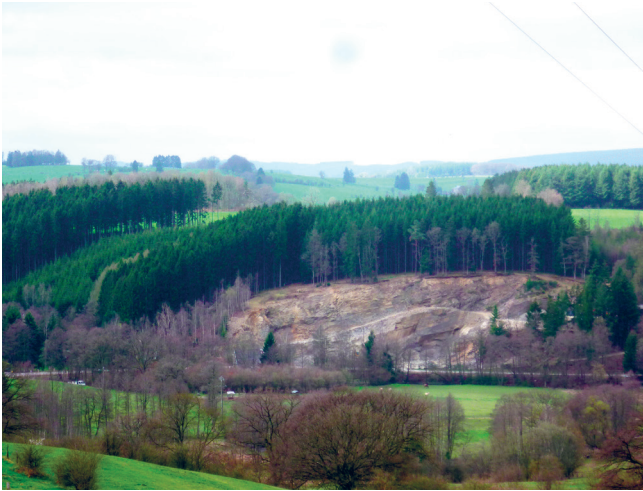
◀ Vue depuis les Villettes vers Bra, JNC AWP, 2017