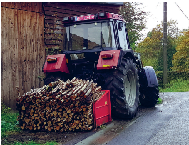
◀ Sylviculture, JNC AWP