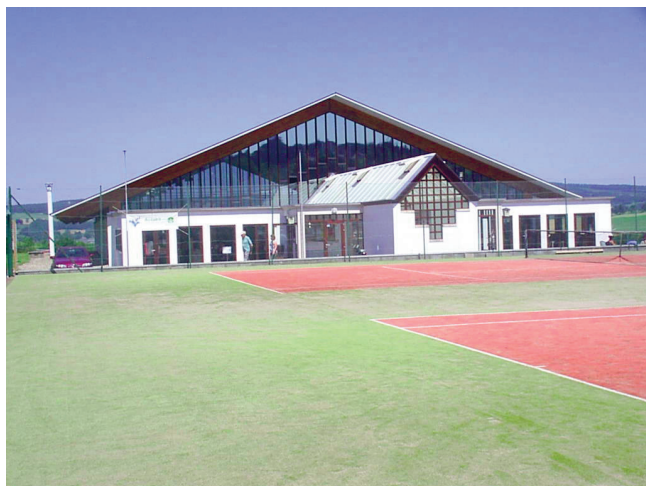
▼ Complexe sportif «Le Point du Jour» à Lierneux, site de la commune