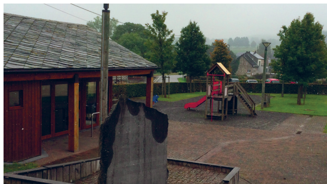
▼ Plaine de jeux à Sart, JNC AWP