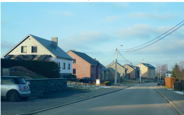
▼ Rue des Marcadènes à Lierneux, JNC AWP