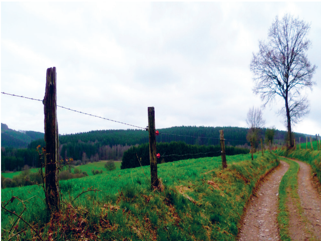
◀ Vue depuis Bra vers l'est de la commune, JNC AWP, 2017