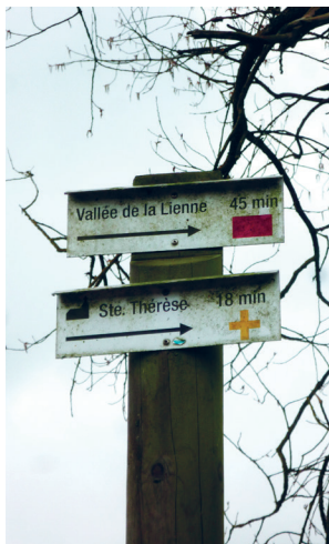
▼ Réseau de promenades et balisage, JNC AWP, 2017

La mise en valeur des ressources et produits locaux ainsi que la recherche d'exemplarité dans les pratiques durables servira à renforcer l'identité et l'attractivité de la commune qui pourrait mettre à profit sa localisation entre deux provinces et s'affirmer dans les circuits touristiques mis en place par le SPDT Liège et le parc naturel des deux Ourthes.