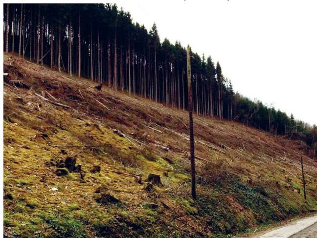
▼ Forêt au bord de la N645 à Trou de Bra, JNC AWP, 2017